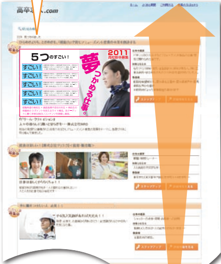
検索結果一覧画面