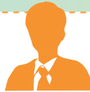
埼玉県 / T 高校 教諭 (進路指導)

生徒から、「先生！高卒求人.comというサイトがあるんだけど！」と言われ、サイトを検索。なるほど仕事内容もわかりやすく、さっそく登録。それからも、生徒たちが学校のPC室であれこれ言い合いながら会社を探している姿を見かけるように。生徒が率先して就職活動をする姿を見て嬉しくなりました！