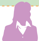
東京都 / ホテル業 採用担当者

生徒から、「先生！高卒求人.comというサイトがあるんだけど！」と言われ、サイトを検索。なるほど仕事内容もわかりやすく、さっそく登録。それからも、生徒たちが学校のPC室であれこれ言い合いながら会社を探している姿を見かけるように。生徒が率先して就職活動をする姿を見て嬉しくなりました！